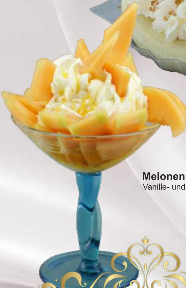
Melonen-Becher (1,4,G) 7,90 € Vanille- und Meloneneis, frische Melone, Melonensoße, Sahne