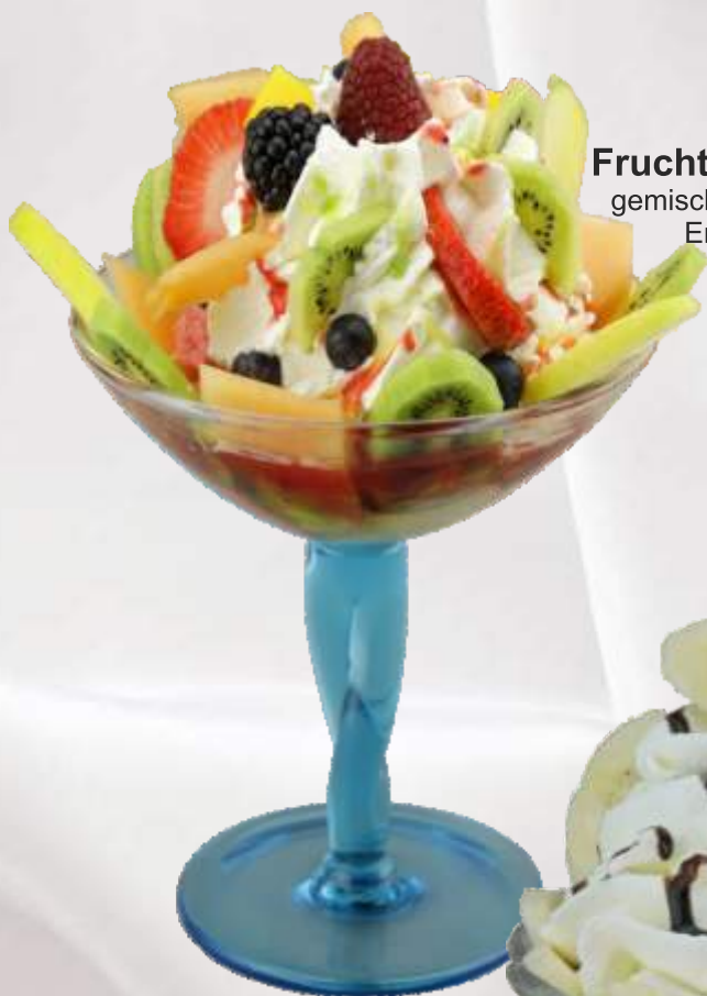
Frucht-Becher (1,4,G) 7,90 € gemischtes Fruchteis, frisches Obst, Erdbeer- und Kiwisoße, Sahne