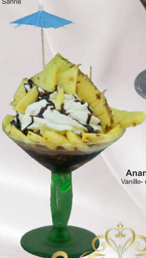
Ananas-Becher (1,G) 7,90 € Vanille- und Schokoeis, frische Ananas, Schokoaldensauce, Sahne (Saisonbedingt)