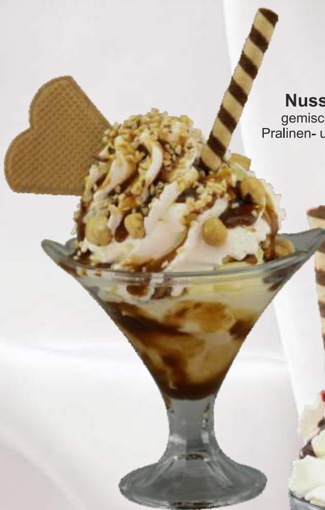
Nuss-Becher (F,G,H) 8,10 € gemischtes Nusseis, Nussmischung, Pralinen- und Haselnusssoße, gehackte Haselnüsse, Sahne