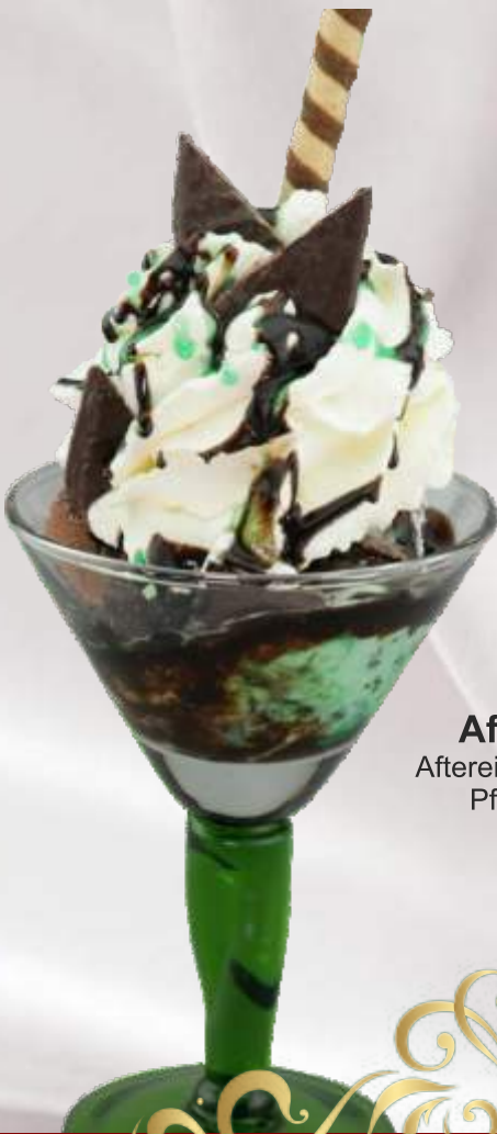
AfterEight-Becher (1,3,4,G) 7,90 € Aftereight-, Schoko-, Stracciatellaeis, Aftereight, Pfefferminz - und Schokoladensoße, Sahne