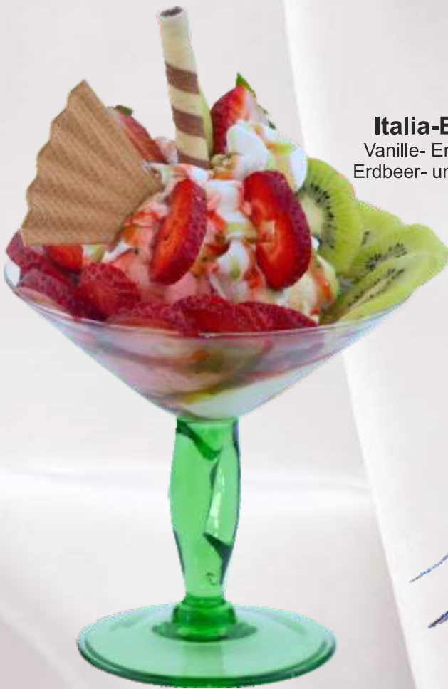
Italia-Becher (1,4,G) 7,90 € Vanille- Erdbeereis, Erdbeeren, Kiwi, Erdbeer- und Kiwisoße, Sahne, weiße Schokoraspel (Saisonbedingt)