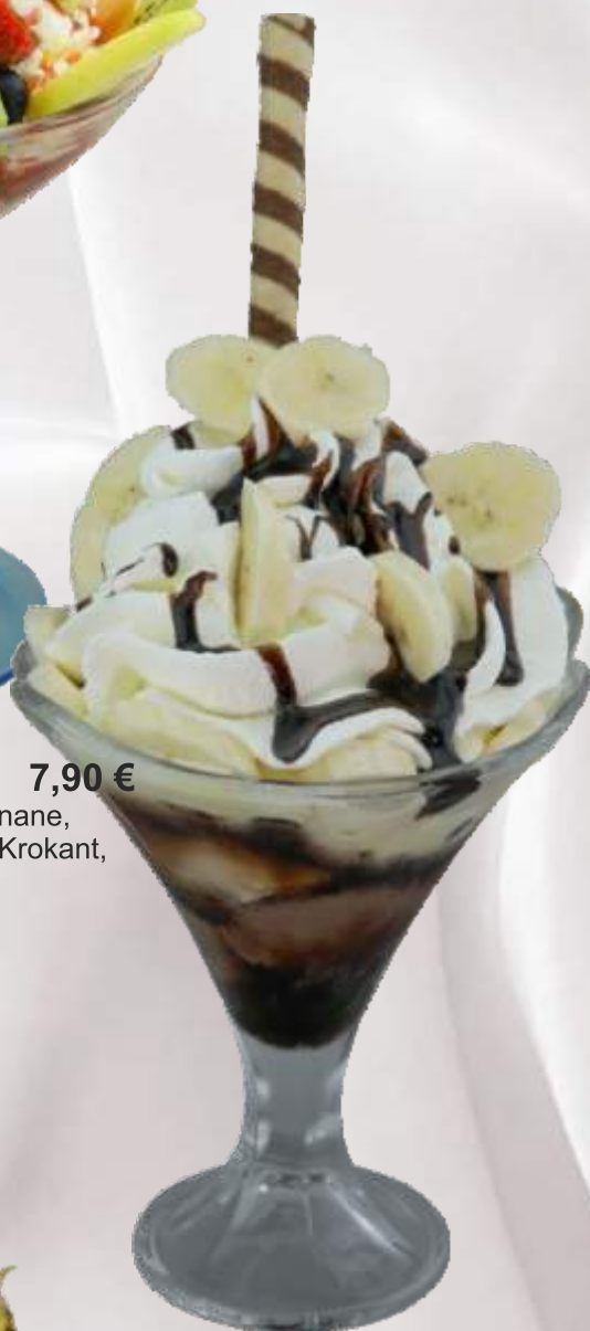
Bananen-Becher (1,4,A,G,H) 7,90 € Bananen-, Vanille-, Schokoeis, Banane, Bananen- und Schokoladensauce, Krokant, Sahne