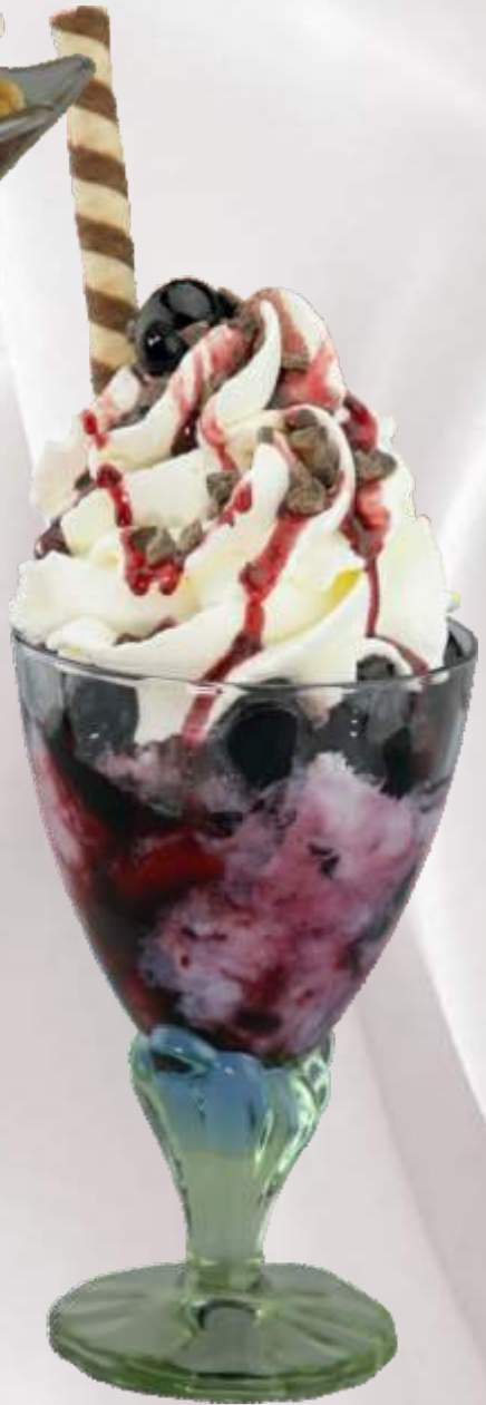
Amarena-Becher (1,3,4,G) 7,90 € Stracciatella-, Schoko-, Amarenaeis, Amarena-soße, Amarenakirschen, Schokoladenraspel, Sahne